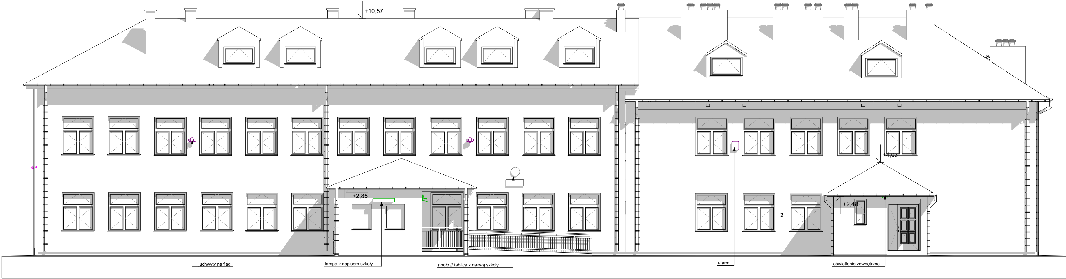
ELEWACJA PÓŁNOCNO-ZACHODNIA 2 SKALA 1:100